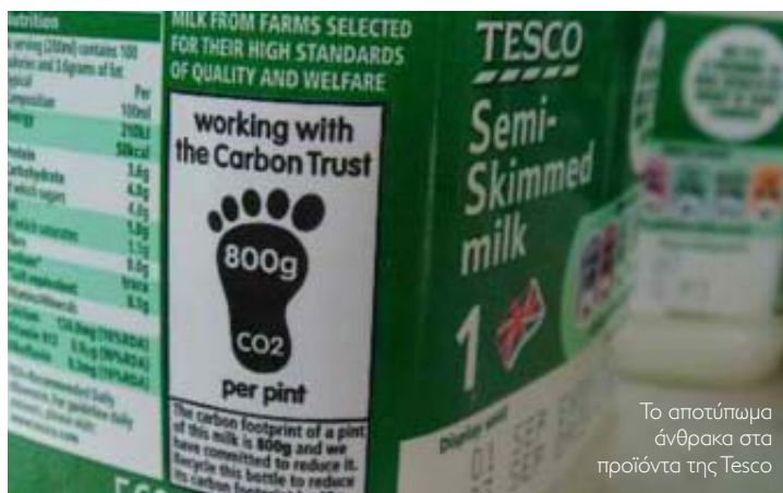
Το αποτύπωμα άνθρακα στα προϊόντα της Tesco

➤ Η μεγαλύτερη αλυσίδα σούπερ μάρκετ της Βρετανίας, η Tesco, ανακοίνωσε τη διακοπή του προγράμματος για την επισήμανση των προϊόντων της με ειδικό σήμα για το αποτύπωμα του άνθρακα, με τον ισχυρισμό ότι πρόκειται για υπερβολικά περίπλοκο μήνυμα. Όπως ωστόσο επισημαίνουν οι Financial Times σε σχετικό τους δημοσίευμα, η έλλειψη ρευστότητας στη βιομηχανία τροφίμων και το οργανωμένο λιανεμπόριο τείνει να ανατρέψει κάποια πολυδάπανα αειφορικά σχέδια δράσης στον κλάδο. Οι υποσχέσεις για την "πράσινη επανάσταση" με την επισήμανση αποτυπώματος άνθρακα δόθηκαν από τον όμιλο σούπερ μάρκετ το 2007, έτος παγκόσμιας οικονομικής αισιοδοξίας, τονίζεται χαρακτηριστι-