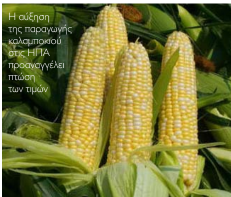
Η αύξηση της παραγωγής καλαμποκιού στις ΗΠΑ προαναγγέλει πτώση των τιμών

> Μετά το μπαράζ των ρεκόρ υψηλών τιμών στα τρόφιμα το 2011, που βοήθησε στην πυροδότηση των εξεγέρσεων της Αραβικής Άνοιξης, υπάρχουν προοπτικές ανακούφισης για τους καταναλωτές σε παγκόσμιο επίπεδο μέσα στο 2012, αν οι αγρότες των ΗΠΑ καλλιεργήσουν φέτος περισσότερα σιτηρά. Σύμφωνα με αναλυτές του πρακτορείου Reuters, οι τιμές σε σόγια, καλαμπόκι και σιτάρι θα παρουσιάσουν πτώση κατά 15% σε σχέση με εκείνες του περασμένου έτους, δεδομένης της μεγαλύτερης παραγωγής, γεγονός που θα ωφελήσει και την κτηνοτροφία, καθώς οι ζωοτροφές θα είναι φθηνότερες. Κατά τις προβλέψεις του USDA και του FAO για την καλλιεργητική περίοδο 2011-2012, η παγκόσμια παραγωγή σιταριού αναμένεται να αυξηθεί κατά 2,7 εκατ. τόνους την καλλιεργητική περίοδο 2011-2012, αύξηση που υπολογίζεται ότι θα οδηγήσει σε πλεόνασμα, με αποτέλεσμα τα παγκόσμια αποθέματα να αυξηθούν κατά 1,5 εκατ.