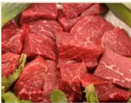
Στην Ε.Ε. οι τιμές βοείου κρέατος είναι χαμηλές για τους παραγωγούς, ενώ το κόστος παραγωγής είναι υψηλό

➤ Την ανάλυση της μεσοπρόθεσμης παραγωγής βοείου κρέατος ανά τον κόσμο και το εμπόριο, προκειμένου να εξασφαλιστεί η βιωσιμότητα της κοινοτικής παραγωγής βοείου κρέατος, ζήτησαν οι κεντρικές αγροτοσυνεταιριστικές οργανώσεις Cora και Cogeca, επισημαίνοντας τις δυσκολίες που αντιμετωπίζει ο κλάδος στην Ευρωπαϊκή Ένωση. Κατά την συνάντηση με εμπειρογνώμονες της Ευρωπαϊκής Επιτροπής τονίσθηκε ότι στην Ε.Ε. οι τιμές είναι χαμηλές για τους παραγωγούς, ενώ το κόστος παραγωγής είναι υψηλό. «Οι τιμές του βοείου κρέατος είναι σχεδόν στα ίδια επίπεδα με το 2008, ενώ το κόστος των ζωοτροφών έχει φτάσει τα επίπεδα του 2008 και αναμένεται περαιτέρω αύξηση. Το 2011, οι τιμές του βοείου κρέατος προβλέπεται ότι θα εξακολουθήσουν να είναι εύθραυστες και θα εξαρτώνται