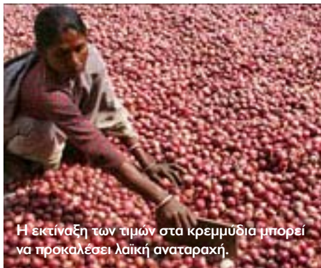
Η εκτίναξη των τιμών στα κρεμμύδια μπορεί να προκαλέσει λαϊκή αναταραχή.

➤ Τα κρεμμύδια αποτελούν βασικό συστατικό σε πάρα πολλά ινδικά παραδοσιακά εδέσματα και έχει αποδειχθεί στο παρελθόν ότι μπορούν να ανατρέψουν κυβερνήσεις στην Ινδία. Με αυτό το σκεπτικό, η κυβέρνηση της Ινδίας αποφάσισε να περάσει σε δράση και απαγόρευσε τις εξαγωγές, μετά την άνοδο στην τιμή του λαχανικού που διπλασιάστηκε, φτάνοντας στις 70 ρουπίες (1,17 ευρώ) ανά κιλό από 35 ρουπίες που κόστιζε την περασμένη εβδομάδα. Όπως χαρακτηριστικά αναφέρει η Wall Street Journal, το 1998, ο συνασπισμός υπό την ηγεσία του κόμματος Bharatiya Janata – ένα από τα δύο μεγαλύτερα κόμματα της Ινδίας – αντιμετώπισε την ήττα σε εκλογική αναμέτρηση στο Δελχί, μετά από δραματική αύξηση στην τιμή των κρεμμυδιών. Από τότε, οι κυβερνήσεις τρέμουν τις αυξήσεις στο αγαπημένο λαχανικό