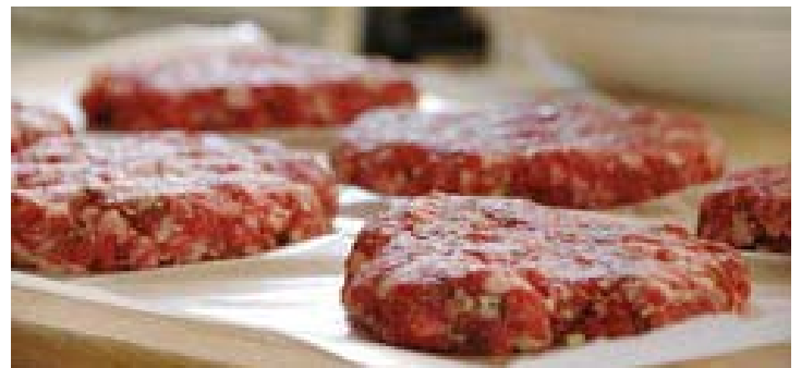
Στο χαμηλότερο επίπεδο εδώ και μια πενταετία έπεσε το ποσοστό κρουσμάτων μολύνσεων από το βακτήριο e.coli

ασφαλείας που έχει θέσει σε εφαρμογή η κυβέρνηση αποδίδουν. Παράλληλα όμως επισημαίνει ότι υπάρχουν ακόμη πολλά κενά που πρέπει να καλυφθούν. Και αυτό γιατί ενώ οι ειδικοί κατέγραψαν μείωση στην εμφάνιση του e-coli, διαπίστωσαν αύξηση στο βακτήριο Vibrio vulnificus που εντοπίζεται κυρίως στα στρείδια και τα λοιπά οστρακοειδή. Την περασμένη χρονιά ο εν λόγω παθογόνος οργανισμός –ο οποίος πολλαπλασιάζεται ακόμη και κατά την διάρκεια της συντήρησης στο ψυγείο– σημείωσε άνοδο κατά 21%. Το συχνότερο αίτιο τροφιογενών λοιμώξεων όμως είναι σύμφωνα με την έκθεση της CDC, η σαλμονέλα. Εντοπίζεται σε διάφορα τρόφιμα, όπως είναι τα νωπά κρέατα, πουλερικά, τα αβγά και τα γαλακτοκομικά