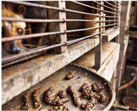
Το συμπαθές αιλουροειδές δίνει τα ακριβότερα καφέ στον κόσμο

➤ Το πιο εκλεκτό χαρμάνι καφέ στον κόσμο... παράγεται με τη βοήθεια των περιπτώσεων μίας εξωτικής γάτας και είναι η νέα μανία στον κόσμο της «καφεγνωσίας»! Ο πανάκριβος καφές ονομάζεται Κορι Luwak και έχει μία πολύ ιδιαίτερη διαδικασία παρασκευής που καθιστά μοναδική τη γεύση του. Παράγεται από μισο-χωνεμένους κόκκους καφέ που συλλέγονται από τα περιττώματα της μוסχογαλής –ένα είδος γάτας που ζει στις ασιατικές χώρες. Κοστίζει περί τα 500 ευρώ το κιλό (!) και για τους αγρότες στις Φιλιππίνες και την Ινδονησία ισοδυναμεί με... χρυσό. Οι λάτρεις του καφέ στην Ευρώπη, τις ΗΠΑ και την ανατολική Ασία το ανακάλυψαν τα τελευταία χρόνια και έκτοτε έχουν εκτοξεύσει τη ζήτησή του στα ύψη. Οι παραγωγοί της συγκεκριμένης ποικιλίας απομονώνουν τους εκλεκτούς σπόρους από την κοπριά, τους καθαρίζουν και στη συνέχεια τους καβουρδίζουν για να του προσδώσουν το μοναδικό του άρωμα. «Το γαστρικό υγρό, τα οξέα και τα ένζυμα από τη ζώα φτάνουν στο εσωτερικό του κόκκου και