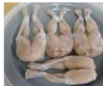
Ανθεί η μαύρη αγορά βατραχοπόδαρων στη Γαλλία

εδέσματα βέβαια προσθέτουν δεν έχουν την ξεχωριστή γεύση των ντόπιων και ζητούν από τα αρμόδια όργανα να προστατεύσουν πάση θυσία την ιδιαίτερη αυτή γαστριμαργική παράδοση της Γαλλίας.