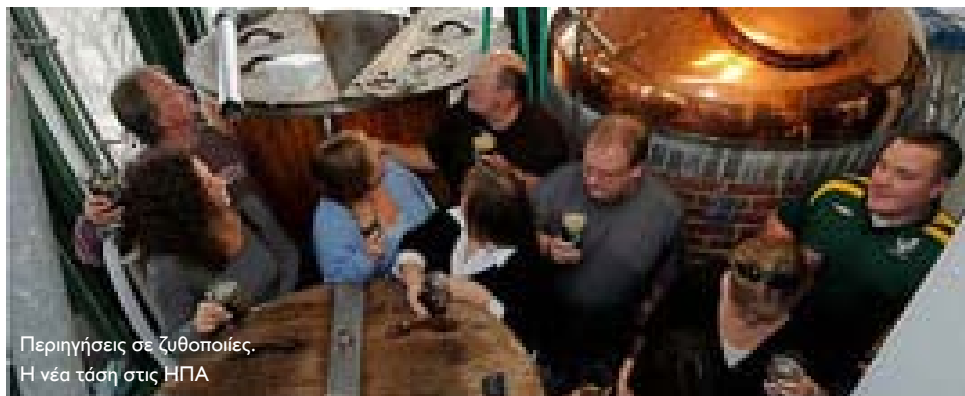
Περιηγήσεις σε ζυθοποιίες. Η νέα τάση στις ΗΠΑ

➤ Είστε λάτρης της μπύρας και θέλετε να μάθετε τα πάντα για την παραγωγή του αγαπημένου σας ποτού, από... τη βυνοποίηση μέχρι τη ζύμωση; Δεν έχετε παρά να συνδυάσετε το τερπνό μετά του ωφελίμου. Δεκάδες εταιρείες ζυθοποιίας στις ΗΠΑ -και όχι μόνο- προσφέρουν πλέον εκδρομικά-εκπαιδευτικά πακέτα σε επίδοξους παραγωγούς, αλλά και σε απλούς τουρίστες που θέλουν να κάνουν κάτι διαφορετικό στις διακοπές τους. Σε ένα ειδυλλιακό τοπίο κάπου στα Λευκά Όρη του