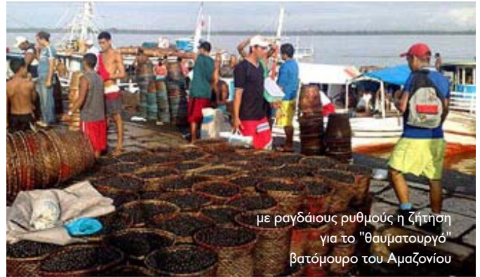
με ραγδαίους ρυθμούς η ζήτηση για το "θαυματουργό" βατόμουρο του Αμαζονίου

ΗΠΑ λόγω χάρη, εκκύλιμα από το μούρο ακάι υπάρχει πλέον στο κόκκινο τσάι της εταιρείας Snapple, ενώ άλλοι μεγάλοι κολοσσοί προσφέρουν αφεψήματα, χυμούς και συμπληρώματα διατροφής με το μικροσκοπικό καρπό. Μέσα στην τελευταία πενταετία, η πολιτεία Παρά στο βορρά της Βραζιλίας -η οποία παράγει σχεδόν το 90% του προϊόντος στη χώρα- είδε τις εξαγωγές της να εκτοξεύονται στα ύψη (σς από 380 τόνους το 2000 στους 9500 τόνους πέρυσι). Η τιμή του προϊόντος αυξήθηκε, οι παραγωγοί βελτίωσαν τις μεθόδους συλλογής των φρούτων, ενώ το βιοτικό επίπεδο αυξήθηκε σε πολλές κοινότητες που ασχολούνται παραδοσιακά με την καλλιέργεια και την επεξεργασία του ακάι. Καθώς ο κόσμος