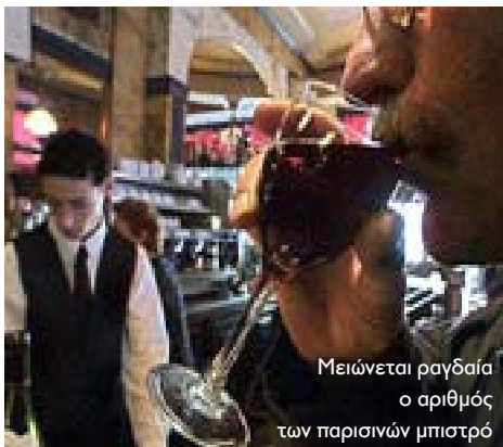
Μειώνεται ραγδαία ο αριθμός των παρισινών μπιστρό

➤ Τα γαλλικά μπιστρό, οι... «ναοί» της κοινωνικής ζωής των Γάλλων, απειλούνται με εξαφάνιση, καθώς τα τελευταία χρόνια ο αριθμός τους σε ολόκληρη τη χώρα μειώνεται με ταχύτατους ρυθμούς. Στη γαλλική επαρχία, υπολογίζεται δύο μπιστρό βάζουν πλέον λουκέτο κάθε μέρα (!), ενώ στην περιφέρεια του Παρισιού περισσότερα από 2 χιλιάδες παραδοσιακά «στέκια», αποχαιρέτησαν τους πελάτες τους μέσα στο 2009. Σήμερα σε ολόκληρη τη χώρα, υπάρχουν μόλις 35 χιλιάδες μπιστρό, την ώρα που τη «χρυσή δεκαετία» του '60, ο αριθμός τους ξεπερνούσε τις 200 χιλιάδες. Η απαγόρευση του καπνίσματος, η εκστρατεία για την καταπολέμηση του αλκοολισμού, η ηλεκτρονική επικοινωνία που καταργεί τη διαπροσωπική επαφή, αλλά και το «πείσμα» των ιδιοκτητών που αρνούνται να συμβαδίσουν με το πνεύμα της εποχής, εξηγούν