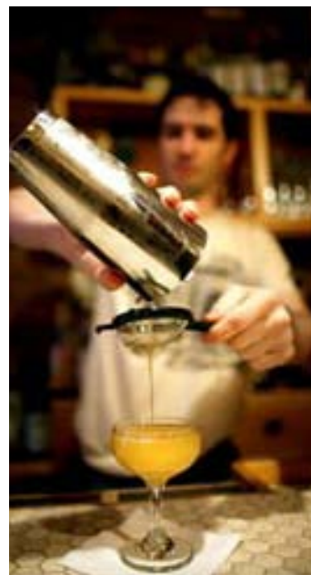
Τα 500 του χρόνια γιορτάζει το διάσημο γαλλικό λικέρ Bénédictine