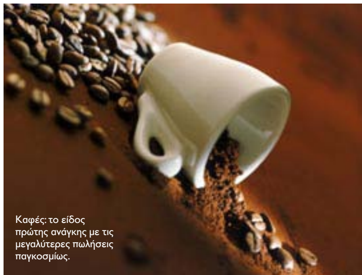
Καφές: το είδος πρώτης ανάγκης με τις μεγαλύτερες πωλήσεις παγκοσμίως.

Και κανένας μέχρι σήμερα δεν έχει ανακαλύψει μία προτεινόμενη ημερήσια δόση που μπορεί να κάνει «θαύματα» στον ανθρώπινο