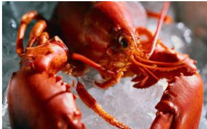
Θύμα της οικονομικής κρίσης και ο αστακός

Την ώρα που η τιμή «καθημερινών» αγαθών, όπως το τσάι, ο καφές και η ζάχαρη αγγίζει ποσοστά ρεκόρ, ο αστακός κόστιζει πλέον στα αμερικανικά σουπερ-μάρκετ περί τα 4,99 δολάρια τα 450 γραμμάρια! Τα τελευταία δύο χρόνια μάλιστα γνωστές αλυσίδες εσποταριών χαμηλού κόστους, όπως τα Ruby Tuesday έχουν συμπεριλάβει στο μενού τους, το θαλασσινό...της καλής κοινωνίας. Τα «δεινά» στην παγκόσμια βιομηχανία επεξεργασίας αλιευμάτων, οι μαζικές απολύσεις εργαζομένων,