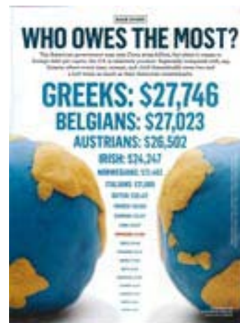
Το αποκαλυπτικό δημοσίευμα του Newsweek

κορυφή της «μαύρης λίστας», με κατά κεφαλήν χρέος που αγγίζει τα 27.746 δολάρια. Ακολουθούν οι Βέλγοι με χρέος ύψους 27.023 δολαρίων, οι Αυστριακοί με 26.502 δολάρια, οι Ιρλανδοί με 24.247 δολάρια, και οι Νορβηγοί με 21.402 δολάρια. Τη δεκάδα συμπληρώνουν οι Ιταλοί (21.089) οι Ολλανδοί (20.412), οι Γάλλοι (18.946), οι Γερμανοί (15.574) και οι Φιλανδοί (13.617), ενώ εντέκατη και τελευταίοι στη λίστα φιγουράρουν οι Αμερικανοί με χρέος που φθάνει για κάθε κάτοικο τα 11.094 δολάρια. Οι πρώτες 10 καταχωρίσεις στη λίστα είναι ευρωπαϊκές χώρες με υψηλές εισφορές κοινωνικής ασφάλισης.