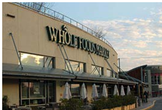
Κίνητρα για καλύτερη υγεία των υπαλλήλων της δίνει η Whole Foods

αναφερόμενος στην εξοικονόμηση κόστους που εκτιμάται ότι θα προκύψει στο πρόγραμμα ιατρικής κάλυψης των υπαλλήλων της. Οι συγκεκριμένες δαπάνες της Whole Foods ανήλθαν, πέρυσι, στα 150 εκατομμύρια δολάρια. Ο ίδιος συντάσσεται με τη θεωρία ότι τα περισσότερα προβλήματα υγείας προκαλούνται από τον ίδιο τον άνθρωπο, λόγω της κακής διατροφής, της έλλειψης άσκησης και ενός γενικότερα επιβλαβούς για την υγεία τρόπου ζωής, ενώ «οι περικοπές δαπανών επιτυγχάνονται από μικρότερη κρατική παρέμβαση