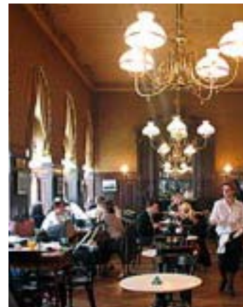
Παραδοσιακό καφέ. Το κλασικό είναι πάντα στη μόδα

Το σύγχρονο καφέ απέχει πολύ από την παραπάνω αισθητική αλλά στο βάθος η ουσία του παραμένει. Με τη διαφορά ότι ο καφές προσφέρεται πια σε διαφορετικές