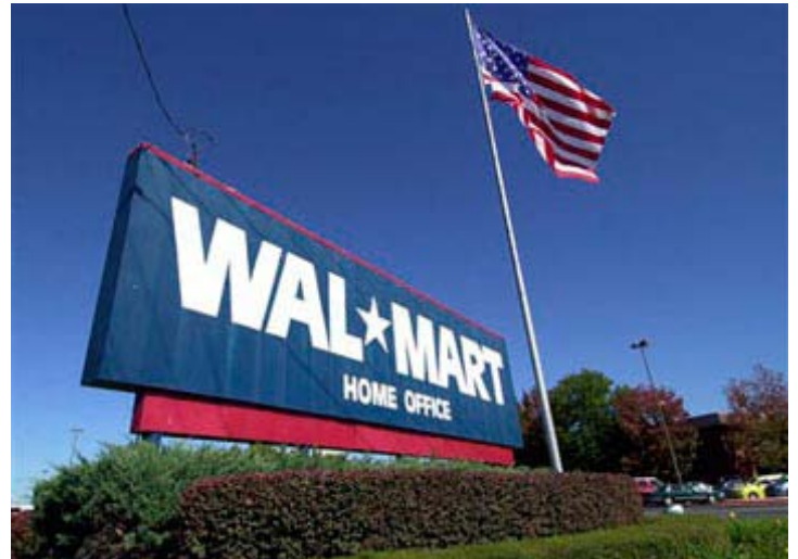
Οι ηλεκτρονικές πωλήσεις είναι το νέο πεδίο που θα επιχειρήσει να κατακτήσει τώρα η Wal-Mart

Μέτρο σύγκρισης είναι ο διπλασιασμός των πωλήσεων της Amazon.com το 2006, φθάνοντας τα 10,7 δισεκατομμύρια δολάρια. Ο κ. Βάσκεζ τονίζει, ωστόσο, ότι η