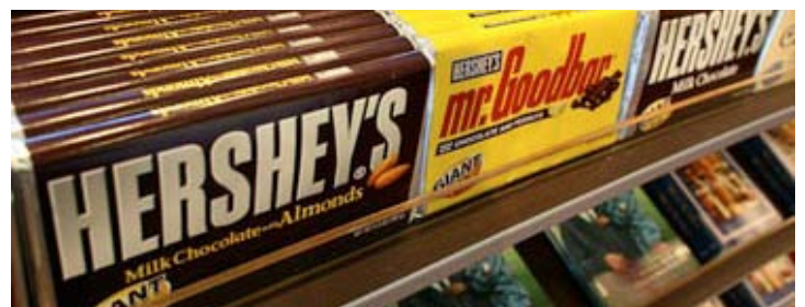
Δυναμικό παρόν για την Cadbury δηλώνει η Hershey

Σύμφωνα με τις εκτιμήσεις των αναλυτών, μια προσφορά από την Hershey θα περιλάμβανε, τουλάχιστον, 10 δισεκατομμύρια δολάρια σε μετρητά όπως και 2 δισεκατομμύρια δολάρια σε νέες μετοχές της εταιρείας. Επιπροσθέτως, υπολογίζεται ότι θα πρέπει να διασφαλιστούν ακόμη 3 με 5 δισεκατομμύρια δολάρια σε μετρητά από τους πλούσιους επενδυτές, οι οποίοι εκτιμάται ότι θα λάβουν μερίδιο στο μετοχικό κεφάλαιο της Hershey. Τους συγκεκριμένους επενδυτές έχει προσεγγίσει ο Μπίρρον Τροτ, πρώην τραπεζίτης της Goldman Sachs, γνωστός για τις στενές σχέσεις που διατηρεί με τον μεγαλοεπενδυτή