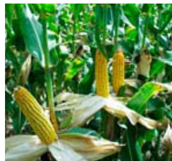
Άλλα τρία μεταλλαγμένα καλαμπόκια στα πιάτα μας.

διακίνησής τους στην ευρωπαϊκή αγορά. Πρόκειται για τα γενετικά τροποποιημένα καλαμπόκια MON88017 και MON89034 της αμερικανικής πολυεθνικής εταιρίας βιοτεχνολογίας Monsanto και το 59122xNK603 της Pioneer Hi-Bred, θυγατρικής της Dupont. Η χορήγηση της δεκαετούς έγκρισης από την Ευρωπαϊκή Επιτροπή αφορά στη χρήση των μεταλλαγμένων καλαμπόκιων τόσο σε τρόφιμα όσο και ζωοτροφές.