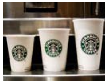
Αύξηση κερδών 20% αναμένει για το 2010 η Starbucks

Από το πρόγραμμα περικοπών η εταιρεία εξοικονόμησε φέτος 580 εκατομμύρια δολάρια ενώ για το 2010 προβλέπει αύξηση κερδών κατά 20% ή 96 σεντς ανά μετοχή. Από αυτό το μήνα ο καφές της Starbucks θα πωλείται και από τα καταστήματα της αλυσίδας εστιατορίων Subway η οποία διαθέτει στις ΗΠΑ 9.000 καταστήματα.