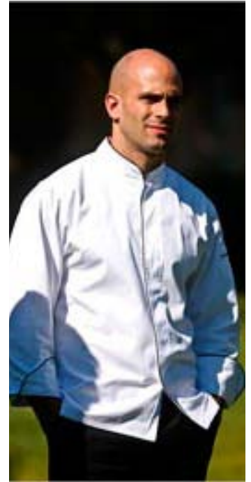
Ο Σαμ Κας, σεφ του Λευκού Οίκου, έχει επικρίνει ουκ ολίγες φορές τις διατροφικές συνήθειες των Αμερικανών.

μας», δηλώνει ο ίδιος στους New York Times. Η Μέλοντι Μπάρνς, σύμβουλος του προέδρου για ζητήματα εσωτερικής πολιτικής, επισημαίνει ότι ο κ. Κας είναι απόλυτα συντονισμένος με τον τρόπο σκέψης της Μισέλ Ομπάμα. Σε μπλογκ του Μουσείου Τζέιν Άνταμς στο Σικάγο, το οποίο αποτελεί ένα ιστορικό μνημείο και σύμβολο του κοινωνικού κράτους των ΗΠΑ, ο κ. Κας συνέδεσε τις αγροτικές επιδοτήσεις των ΗΠΑ με το εθνικό πρόγραμμα διατροφής, το οποίο επέκρινε για τη δυσανάλογη περιεκτικότητα λιπαρών ουσιών, συντηρητικών και μεγάλης ποσότητας φρουκτόζης. «Είμαστε αντιμέτωποι με ένα σύστημα που λειτουργεί με γνώμονα την ποσότητα και όχι την ποιότητα», είχε γράψει στο μπλογκ του μουσείου.