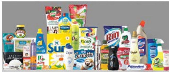
Πτώση των τιμών λιανικής αναμένει η Unilever

> Για μια παρατεταμένη περίοδο πτωτικής πορείας των τιμών στα τρόφιμα, δηλαδή αποπληθωρισμού, προειδοποίησε ο διευθύνων σύμβουλος του ομίλου καταναλωτικών ειδών Unilever, Πωλ Πόλμαν, στο πλαίσιο της ανακοίνωσης των αποτελεσμάτων για το τρίτο τρίμηνο. Παρά τις δυσάρεστες επισημάνσεις του, ο κ. Πόλμαν έχει κερδίσει την εμπιστοσύνη των επενδυτών, με την τιμή της μετοχής της Unilever, στο χαρτοφυλάκιο προϊόντων της οποίας περιλαμβάνεται το τσάι Lipton και το σαμπουάν Sunsilk, να παρουσιάζει άνοδο 36% μέσα στο τελευταίο εξάμηνο. Κατά κανόνα, «η ισχυρή απασχόληση, με τη