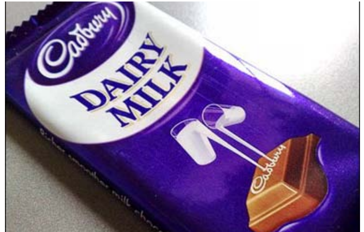
Χαμηλή χαρακτήρισε η Cadbury την προσφορά της Kraft

Η πρόεδρος και διευθύνουσα σύμβουλος της Kraft, Ιρίν Ρόζφλεντ, δήλωσε αυτόν τον μήνα ότι ο αμερικανικός όμιλος παραμένει σταθερός στην πρότασή του, ενώ η Cadbury την χαρακτήρισε ως «μια μη ελκυστική προοπτική από έναν όμιλο με υποτονική ανάπτυξη». Εάν, τελικά υπάρξει συμφωνία, το όφελος από την εξοικονόμηση δαπανών μπορεί να φθάσει στα 625 εκατομμυρίων δολάρια, ετησίως, με χαρτοφυλάκιο 50 προϊόντων, συμπεριλαμβανομένης της τσίκλας Trident και τη σοκολάτα Dairy Milk της Cadbury's. Τα επίσης έσοδα θα ανέλθουν σε 50 δισεκατομμύρια δολάρια σύμφωνα με τις εκτιμήσεις της Kraft. Επιπροσθέτως, η Kraft θα έχει την ευκαιρία να ενισχύσει την παρουσία της στις ταχέως αναπτυσσόμενες αγορές της