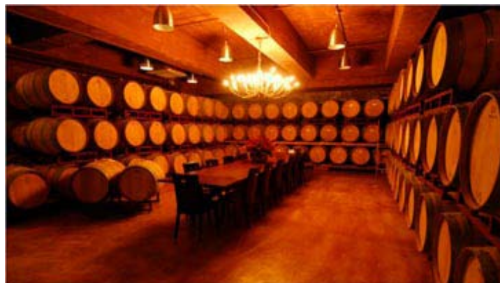
Οι συλλογές από βαρέλια κρασιού είναι η νέα τάση για του λάτρεις του κρασιού στο Χονγκ Κονγκ

Η μεγάλη ανάπτυξη της αγοράς κρασιού στο Χονγκ Κονγκ μέσα σε ένα χρόνο έχει δημιουργήσει υπηρεσίες που είναι αρκετά πρωτότυπες. Για παράδειγμα, η Sarmet που ειδικεύεται στην παροχή υπηρεσιών, δηλαδή, γνώσεων και εμπειρίας, σε προσωπικό επίπεδο από οινοκόμους που έχουν εργαστεί σε κάποια από τα καλύτερα εστιατόρια του κόσμου με τρία ή ακόμη και τέσσερα Michelin. Εκεί η συνδρομή μπορεί να φθάσει έως και τις 12.000 στερλίνες, ενώ για να γίνει κάποιος μέλος θα υποχρεωθεί να καταβάλει το ευκαταφρόνητο ποσό...των 50.000 δολαρίων Ουσιαστικά, ο sommelier, δηλαδή ο οινοκόμος, επισκέπτεται το κελάρι ενός μέλους της εταιρείας για να προτείνει τους καλύτερους τρόπους αναβάθμισης της συλλογής. Επίσης, η εταιρεία μπορεί να παραχωρήσει υπηρεσίες σ' ότι αφορά τις δημοπρασίες κρασιών, οι οποίες πολλές φορές μπορεί να εκτροχιαστούν σε εξωπραγματικά επίπεδα. «Η τιμή ενός μπουκαλιού μπορεί να φθάσει ακόμη και σε