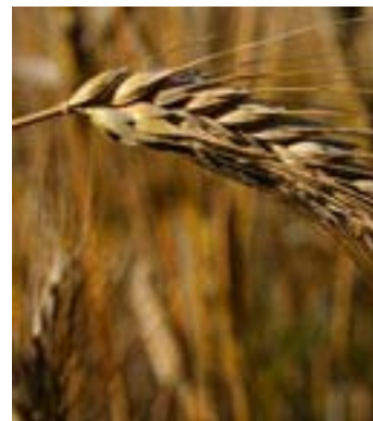
Για καταστράτηγηση της κοινοτικής νομοθεσίας στους ελέγχους δημητριακών κατηγορεί η ΕΕ τη χώρα μας

➤ Στο ευρωδικαστήριο παραπέμπεται η χώρα μας για τα εμπόδια που θέτει μέσω των μέσω των αυξημένων φυτοϋγειονομικών ελέγχων, στις εισαγωγές δημητριακών από τρίτες εκτός Κοινότητας χώρες, αλλά και από κράτη μέλη, όπως η Βουλγαρία και η Ρουμανία. Η Ευρωπαϊκή Επιτροπή στρέφεται κατά της απόφασης της προηγούμενης κυβέρνησης το Φθινόπωρο του 2008 με την οποία καθιερώνονταν αυξημένοι φυτοϋγειονομικοί έλεγχοι και έλεγχοι για μεταλλαγμένο καλαμπόκι και σιτάρι κατηγορώντας τη χώρα μας ότι είχε στόχο να στηρίξει τις τιμές των εγχώριων προϊόντων. Η χώρα μας κατηγορείται για παραβίαση των κοινοτικών κανονισμών περί ελέγχων στα δημητριακά και για καταστράτηγηση του κοινοτικού κανονισμού για το εμπόριο αγροτικών προϊόντων