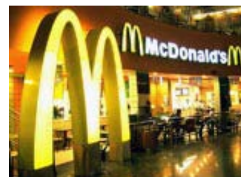
Η McDonald's αποχαιρέτα την Ισλανδία

κέρδη βρίσκονται στο χαμηλότερο σημείο από ποτέ. Ο κ. Όγκμουνσον αποφάσισε να κρατήσει τα εστιατόρια αλλά με άλλη επωνυμία για να μπορεί να αγοράζει στο εξής φθηνότερα ισλανδικά προϊόντα.