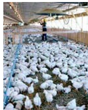
Σε επιφυλακή βρίσκονται οι ελληνικές αρχές για την γρίπη των πτηνών

ρεύματος αγρίων πτηνών από την Ισπανία και για το λόγο αυτό επιβάλλεται η πιστή εφαρμογή των μέτρων βιοασφάλειας στην αντιμετώπιση της γρίπης των πτηνών. Τα μέτρα περιλαμβάνουν: την αποφυγή πώλησης πουλερικών σε υπαίθριες αγορές, απαγόρευση της διατήρησης πουλερικών σε ανοιχτούς χώρους καθώς και η αποφυγή επαφής μεταξύ πουλερικών εκτροφών και κατοικίδιων ζώων.