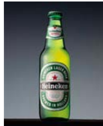
Και ιδιοκτήτρια ρυβ τώρα η Heineken

συμφωνία περιλαμβάνεται η δυνατότητα της Heineken να αποκτήσει εκ ολοκλήρου την Globe στο τρίτο τρίμηνο του 2010. Όπως οι περισσότερες ρυβ στη Βρετανία έτσι και η Globe αντιμετωπίζει κάθετη πτώση των εσόδων της αφ ενός λόγω της απαγόρευσης του καπνίσματος και αφ ετέρου λόγω της οικονομικής κρίσης που οδηγεί τον κόσμο να αγοράζει αλκοολούχα ποτά από τα σούπερ μάρκετ.