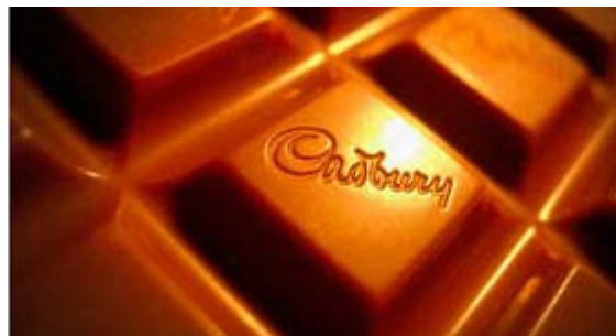
Την επόμενη Δευτέρα «κληρώνει» για την Cadbury

➤ Η βρετανική σοκολατοβιομηχανία Cadbury, προετοιμάζεται για να αμυνθεί σε πιθανή επιθετική εξαγορά από την Kraft που υπολογίζεται ότι θα φτάσει τα 20 εκατομμύρια λίρες (16 δισεκατομμύρια δολάρια). Στις 9 Νοεμβρίου λήγει η διορία που είχε πάρει η Kraft από τη βρετανική επιτροπή ανταγωνισμού για να καταθέσει τις προτάσεις της και η αμερικανική εταιρεία έχει τρεις επιλογές. Είτε να προχωρήσει σε επιθετική εξαγορά, είτε να διαπραγματευτεί με την Cadbury προσπαθώντας να βρει μια συμβιβαστική λύση, είτε να αποχωρήσει. Αν η αμερικανική εταιρεία προχωρήσει σε επιθετική εξαγορά, που είναι και το πιο πιθανό, θα πρέπει να αυξήσει