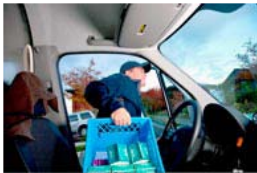
Όλο και περισσότεροι καταναλωτές στις ΗΠΑ προτιμούν την κατ' οίκον διανομή γάλακτος

Δηλαδή μπορεί να ξεκινήσει από τη φάρμα και να καταλήξει στο τραπέζι του πρωινού μέσα σε 48 ώρες, αποτελώντας ένα αυτούσιο προϊόν, το οποίο πολλές φορές προέρχεται από βιολογικές φάρμες. Υποβάλλεται, παράλληλα, σε λιγότερη παστερίωση συγκριτικά με το γάλα που καταλήγει στα ράφια