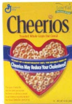
Αυξήσεις στις τιμές λιανικής των τροφίμων αναμένονται στις ΗΠΑ

προηγούμενο τρίμηνο κατάγραψε εντυπωσιακή αύξηση κερδών 51% ανακοίνωσε ότι δεν θα προχωρήσει σε αυξήσεις πάνω από 5%. Η εταιρεία ισχυρίζεται ότι μπορεί να αποφύγει την αύξηση των τιμών στο ράφι, με το πρόγραμμα περιορισμού του κόστους που έχει ξεκινήσει και που περιλαμβάνει την απλοποίηση των προϊόντων. Για παράδειγμα μέχρι πρόσφατα ένα συγκεκριμένο προϊόν έβγαине σε 75 διαφορετικές γεύσεις και σήμερα έχει περιοριστεί στις 30. Σύμφωνα με τον διευθύνοντα σύμβουλο της General Mills Κένταλ Πάουελ η εταιρεία επωφεληθήκε από την κρίση καθώς οι τιμές τις ήταν ιδιαίτερα χαμηλές. Στα σχέδια της εταιρείας βρίσκεται η