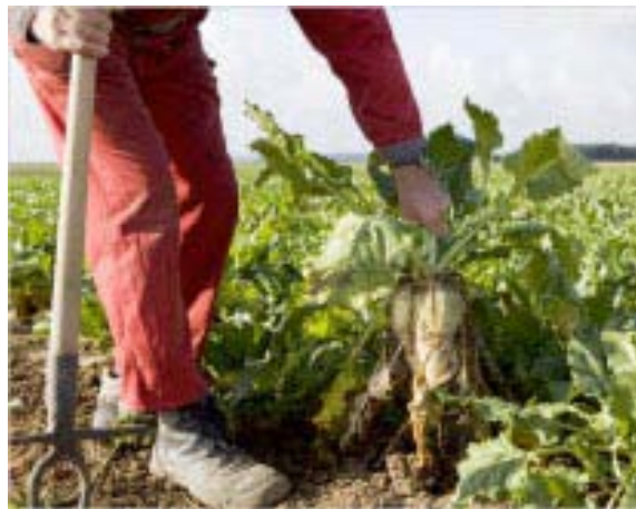
Τεράστια ποσά ευρωπαϊκών επιδοτήσεων δίδονται αντικανονικά κάθε χρόνο σε παραγωγούς ζάχαρης

Σύμφωνα με ρεπορτάζ των New York Times, στο πρόγραμμα επιδοτήσεων της Ευρωπαϊκής Ένωσης ύψους 50 δισεκατομμυρίων ευρώ ετησίως, δεν υπάρχει άλλο εμπόρευμα που να προσφέρει τέτοιες δυνατότητες απάτης όπως η ζάχαρη. Ο ετήσιος τζίρος του κλάδου ανέρχεται σε 7 δισεκατομμύρια ευρώ και πέρυσι η ΕΕ δαπάνησε 475 εκατομμύρια ευρώ σε επιδοτήσεις για να διατηρήσει υψηλή την τιμή της. Οι ευρωπαϊκοί παραγωγοί εκμεταλλεύθηκαν στο έπακρο το σύστημα των επιδοτήσεων με τη Γαλλία και την Ιταλία να είναι οι χώρες που εισέπραξαν τη μερίδα του λέοντος (περίπου 260 εκατομμύρια