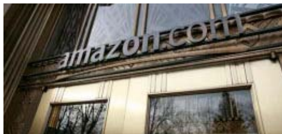
Ευκαιρίες για κέρδη κρύβει η εορταστική περίοδος για το ηλεκτρονικό εμπόριο

ελπίζοντας να περιορίσουν τις απώλειές τους από τις εκπτώσεις που θα κάνουν αναγκαστικά στην τελευταία περίοδο των γιορτών. Πρόσφατη έρευνα, έδειξε ότι περίπου το 50% των λιανεμπόρων στις ΗΠΑ θα μειώσει τον αριθμό του προσωπικού του κατά 5% έως 12% σε σχέση με ένα χρόνο πριν. Η σπουδή των on line λιανεμπόρων έρχεται μετά από έρευνα της comScore Inc η οποία έδειξε ότι η φετινή εορταστική περίοδος θα είναι καλύτερη από την περυσινή όπου υπήρξε μείωση των πωλήσεων κατά 3%. Φέτος το 80% των