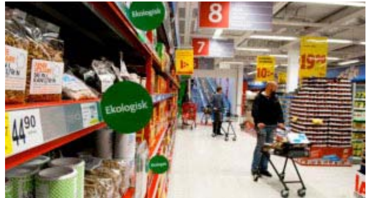
Σήμανση με τις εκπομπές ρύπων και στα τρόφιμα. Η νέα τάση στη Σουηδική αγορά

Επίσης συστήνει στους καταναλωτές να αντικαταστήσουν το βόειο κρέας με πουλερικά και φασόλια, καθώς τα βοοειδή εκπέμπουν μεγάλες ποσότητες διοξειδίου του άνθρακα. Όχι βέβαια ότι όλοι ακολουθούν αυτούς τους κανόνες. Αν πάντως οι αρχές αυτές τηρούνταν κατά