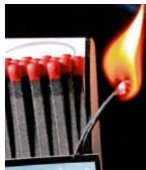
Σπέρτα. Η γοητεία τους είναι παντοτινή

➤ Το κάπνισμα απαγορεύεται πλέον στο σύνολο των εστιατορίων και μπαρ των ΗΠΑ. Τι δουλειά έχουν λοιπόν τα σπέρτα σε περίοπτη θέση για τους πελάτες. Μετά από μια περίοδο όπου τα σπέρτα εξαφανίστηκαν από τους πάγκους των μπαρ και των εστιατορίων, έχουν αρχίσει να κάνουν την επανεμφάνισή τους και μάλιστα με μεγάλη ζήτηση. Τα εστιατόρια τα παραγγέλνουν κατά χιλιάδες και οι πωλήσεις έχουν σχεδόν αγγίξει επίπεδα εποχής, προ απαγόρευσης καπνίσματος. Για τους εστιάτορες και τους ιδιοκτήτες μπαρ αποτελούν μια καλή και φθηνή διαφήμιση και όλο και περισσότεροι κάνουν παραγγελίες.