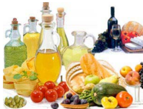
Τη σχέση μεσογειακής διατροφής και κατάθλιψης εκτιμών ότι ανακάλυψαν Ισπανοί επιστήμονες

συνήθειες. Με βάση μια κλίμακα από το μηδέν μέχρι το δέκα που δημιούργησαν οι ερευνητές, οι εθελοντές κατατάσσονταν ανάλογα με τη διατροφή τους. Όσο πιο υψηλό το νούμερο τόσο πιο πιστός στη μεσογειακή διατροφή ήταν ο εθελοντής. Στο τέλος, όσοι βαθμολογήθηκαν μεταξύ 5 και 9 αποδείχθηκε ότι είχαν 42-51% λιγότερες πιθανότητες να παρουσιάσουν κατάθλιψη σε σχέση με όσους βαθμολογήθηκαν από 0 έως 4. Η έρευνα χρηματοδοτήθηκε από την ισπανική κυβέρνηση και διεξήχθη από το Εθνικό Ίδρυμα για την Υγεία Carlos III και στόχος της ήταν να καταδείξει τη σχέση μεταξύ κατάθλιψης και διατροφής. Σύμφωνα με τον επικεφαλής της