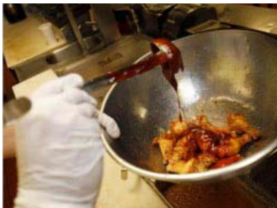
Οι τιμές χονδρικής στις φτερούγες κοτόπουλου ξεπέρασαν τις τιμές του φιλέτου στήθους

Όπως σημειώνουν οι New York Times, αιτία είναι η μεγάλη αύξηση της τιμής χονδρικής στις φτερούγες, που έφτασε να ξεπεράσει αυτή του φιλέτου στήθους. Το Σεπτέμβριο για παράδειγμα, η τιμή χονδρικής για φτερούγες ήταν 2,96 δολάρια το κιλό ενώ για το στήθος 2,42