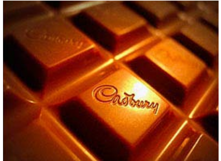
Η προσφορά των 16,9 δισ. δολαρίων της Kraft για την Cadbury δεν ευδοκίμησε. Η Kraft βρίσκεται τώρα σε διαδικασία αναζήτησης κεφαλαίων.

Σύμφωνα με ξένα δημοσιεύματα δεν αποκλείεται στο παιχνίδι να μπει και η Nestle κάνοντας κοινή προσφορά με τη Hershey. Σε αυτή την περίπτωση εκτιμάται ότι το τίμημα μπορεί να φτάσει και τα 21 δισεκατομμύρια δολάρια. Άλλοι πιθανοί διεκδικητές είναι η Kellogg Inc. και η PepsiCo, με λιγότερες όμως πιθανότητες. Η Kraft από την πλευρά της πάντως δε έχει αποσυρθεί από τη διεκδίκηση και ακόμη προσπαθεί να σύρει