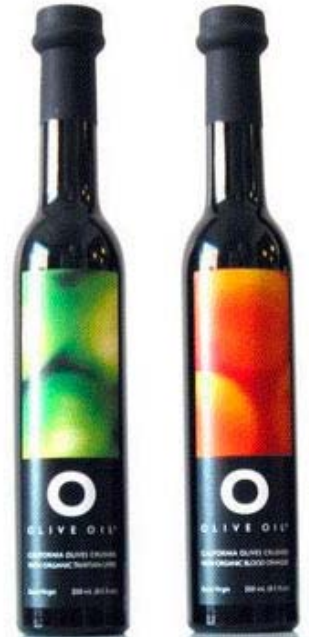
Τα βιολογικά ιδιωτικής ετικέτας κατέχουν αυτή τη στιγμή το 22,7% της αγοράς, ποσοστό ιδιαίτερα υψηλό

Η απόφαση δεν ήταν εύκολη για πολλές εταιρείες, καθώς στην ουσία με την κίνησή τους αυτή ανταγωνίζονται τον εαυτό τους. Σε μια περίοδο όμως που οι καταναλωτές γίνονται όλο και πιο διστακτικοί και μάλιστα τη στιγμή που οι τιμές στα συμβατικά προϊόντα υποχωρούν, η ιδιωτική ετικέτα τους δίνει ένα ανταγωνιστικό πλεονέκτημα.