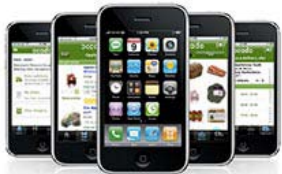
Η Ocando έθεσε ήδη σε πλήρη εφαρμογή την υπηρεσία iPhone.

Η εταιρεία συζητά ήδη την είσοδό της στο χρηματιστήριο αλλά σύμφωνα με τα λεγόμενα στελεχών της αυτό που εξετάζεται είναι ο σωστός χρόνος για κάτι τέτοιο, με δεδομένο την αδυναμία των αγορών στην παρούσα φάση λόγω της οικονομικής κρίσης. Η αξία της εταιρείας στο χρηματιστήριο θα κυμανθεί σύμφωνα με εκτιμήσεις μεταξύ 500 και 600 εκατομμυρίων λιρών.