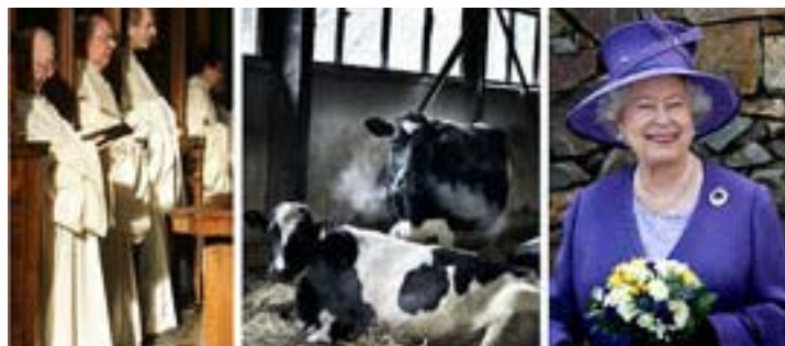
Ανάμεσα στους παραλήπτες μεγάλων ποσών των ευρωπαϊκών αγροτικών επιδοτήσεων ήταν Αυστριακό μοναχό, η Βασίλισσα της Αγγλίας, καθώς και ο συνέταιρος του Δούκα του Βεστμίνστερ.

Η Ευρωπαϊκή Ένωση θεωρεί ότι τα χρήματα αυτά, ουσιαστικά επιστρέφουν στον ίδιο τον παραγωγό, γιατί διαφορετικά οι βιομηχανίες θα αναζητούσαν φθηνότερη πρώτη ύλη σε άλλες αγορές. Βέβαια με αυτό τον τρόπο πλήττονται οι φτωχοί αγρότες στον αναπτυσσόμενο κόσμο, αλλά γι' αυτό δεν μπορεί να κατηγορηθεί μόνο η Ευρώπη. Οι επικριτές του