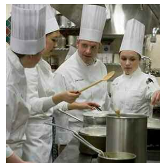
Το ICE στις Η.Π.Α. σημείωσε ρεκόρ με 20.000 αιτήσεις εγγραφής

➤ Τον τελευταίο καιρό, όλα κυμαίνονται γύρω από τα τρόφιμα. Τηλεοπτικές εκπομπές όπως τα αμερικανικά «Hell's Kitchen» και «Top Chef» κλέβουν την παράσταση. Τα διατροφικά σκάνδαλα μας προκαλούν αμφιβολίες για τα προϊόντα που τρώμε και απορίες για το πώς μπορούμε να κάνουμε αυτά πιο ασφαλή. Τα βιβλία μαγειρικής γίνονται ανάρπαστα. Ακόμα και η πρώτη κυρία των ΗΠΑ, Michelle Obama, φύτεψε προσφάτως έναν λαχανόκηπο στην αυλή του Λευκού Οίκου. Δεν θα έπρεπε λοιπόν να προκαλεί έκπληξη το γεγονός ότι ολοένα και περισσότεροι απολυμένοι εργαζόμενοι αλλά και νέοι άνθρωποι που τώρα εισχωρούν στην εργασιακή αγορά, αναζητούν μια σταδιοδρομία στον κλάδο των τροφίμων. Σύμφωνα με πρόσφατο δημοσίευμα του msnbc.com τον τελευταίο χρόνο, το Institute of Culinary Education (ICE) στην Αμερική, σημείωσε ρεκόρ με 20.000 αιτήσεις εγγραφής και συνολικά 12% αύξηση από την τελευταία χρονιά. Σύμφωνα με τον πρόεδρο της σχολής, Rick Smilow, η αύξηση αυτή είναι άμεσα συνυφασμένη με την παρούσα οικονομική κρίση. Ο αντιπρόεδρος του ICE Marck Erickson παρατηρεί ότι ο κόσμος έχει αρχίσει να αναθεωρεί τη σημασία του φαγητού στη ζωή μας και προσθέτει ότι το φαγητό έχει καθιερωθεί ως καθημερινό θέμα τόσο από άποψη υγείας, αλλά και με εξέχουσα σημασία στην πολιτική και κοινωνική ζωή. Είναι λοιπόν πράγματι κατάλληλη η στιγμή για όσους σκέφτονται μια σταδιοδρομία στον κλάδο των τροφίμων.