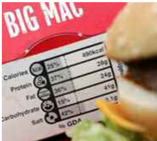
Μια συσκευασία McDonald's που αναγράφει ήδη τις διατροφικές πληροφορίες του προϊόντος

Ο επικεφαλής της Αρχής Ελέγχου Τροφίμων από