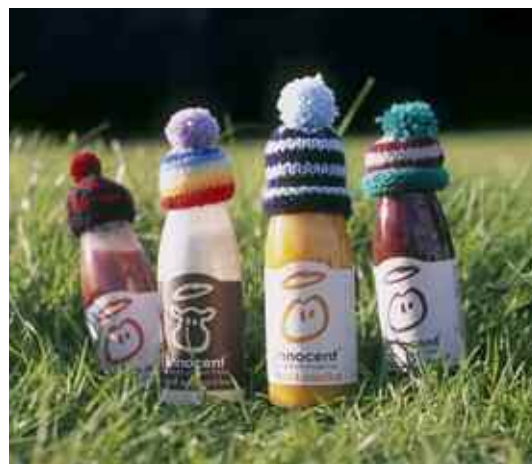
Η Coca Cola είναι ο νέος επενδυτής στην εταιρεία Innocent

Την ίδια στιγμή η Coca Cola προχωρά σε μια συμμαχία που αναμένεται να βελτιώσει κατά πολύ το προφίλ της. Συγκεκριμένα η Innocent Drinks, η εταιρεία παραγωγής φυσικών χυμών και ροφημάτων,