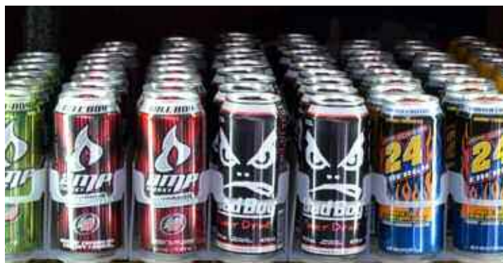
Η κατανάλωση υψηλών ποσοτήτων καφεΐνης την οποία περιέχουν αυτά τα ποτά συνδέεται με περιπτώσεις επικίνδυνης και επιθετικής συμπεριφοράς

➤ Τον κώδωνα του κινδύνου κρούουν Αμερικανοί επιστήμονες για την υπερβολική κατανάλωση ενεργειακών ποτών, μια αγορά που μόνο στις ΗΠΑ αγγίζει τα τρία δισεκατομμύρια δολάρια σε ετήσια βάση. Σύμφωνα με νέα μελέτη που δημοσιεύθηκε στο Journal of American College Health, η κατανάλωση υψηλών ποσοτήτων καφεΐνης την οποία περιέχουν αυτά τα ποτά συνδέεται με περιπτώσεις επικίνδυνης και επιθετικής συμπεριφοράς όπως, σεξουαλικής επαφής χωρίς προφυλάξεις, παρενόχληση ή βιασμός.