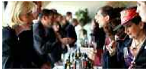
Δοκιμή κρασιού στο οινοποιείο Smith Haut Lafitte στη νοτιοδυτική Γαλλία. Το οινοποιείο ξεκίνησε να παρουσιάζει στους πελάτες του τα πρώτα δείγματα της σοδειάς του 2008.

➤ Τέτοια εποχή, από το 1970, οι ειδικοί του κρασιού συρρέουν στο Μπροντό για να δοκιμάσουν τη νέα σοδειά των περίφημων κρασιών. Ποτέ όμως δεν το είχαν κάνει εν μέσω τόσο σοβαρής οικονομικής κρίσης. Η αγορά του κρασιού λειτουργεί λίγο σαν την αγορά παραγώγων. Τα κρασιά αγοράζονται ενώ βρίσκονται ακόμη στο βαρέλι και στη συνέχεια «πωλούνται και αγοράζονται αέρα» μέχρι τη στιγμή της εμφιάλωσής τους. Αυτό που συνέβη με τη φούσκα της Γουόλ Στριτ και τις κτηματαγορές στις ΗΠΑ και άλλες χώρες, συνέβη λίγο ως πολύ και στην αγορά του κρασιού. Τα συμβόλαια που άλλαζαν συνεχώς χέρια δημιούργησαν επίσης μια φούσκα και τώρα οι άνθρωποι που οδήγησαν τις τιμές στα ύψη εξαφανίστηκαν ή πουλήσαν τα συμβόλαιά τους προκειμένου να αποφύγουν τα χειρότερα. Πολλά από αυτά όμως πήγαν σε χέρια τραπεζών και κερδοσκόπων που δεν έχουν ιδέα τι σημαίνει να έχεις