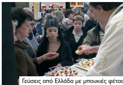
Γεύσεις από Ελλάδα με μπουκιές φέτας

Το περίπτερο της εταιρείας διέθετε 2 infokiosk εξοπλισμένα με touch screens μέσω των οποίων οι επισκέπτες μπορούσαν να πάρουν πληροφορίες για τη φέτα και τα υπόλοιπα ελληνικά τυριά ΠΟΠ στα ολλανδικά. Οι πληροφορίες αφορούσαν την παραγωγή, την ιστορία, τη σημασία των προϊόν-