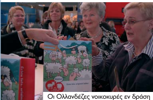
Οι Ολλανδέζες νοικοκυρές εν δράση

Για φτάσουν στο στόχο τους επινόησαν διασκεδαστικές μεθόδους επικοινωνίας, όπως διαγωνισμούς και test στα οποία ο κάθε συμμετέχων κέρδιζε ειδικά σχεδιασμένο σάκο που περιείχε ένα φυλλάδιο συνταγών