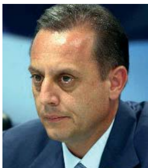
κ. Αντώνης Μπέζας, υφυπουργός Οικονομίας & Οικονομικών

ΤΗΝ «τρύπα» του προϋπολογισμού, επιδιώκει να καλύψει το υπουργείο Οικονομίας και Οικονομικών το οποίο ξεκινά «σαφάρι» ελέγχων στις περιοδικές δηλώσεις ΦΠΑ που υποβλήθηκαν το τελευταίο τρίμηνο. Με βάση