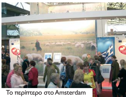
Το περίπτερο στο Amsterdam

αποκόμισε τα καλύτερα σχόλια από το κοινό που αγάλιασε το περίπτερο της εταιρείας προκειμένου να ενημερωθεί για τα ελληνικά προϊόντα, να λάβει μέρος στους διαγωνισμούς που διεξήχθησαν και να μιλήσει με τους ανθρώπους της εταιρείας οι οποίοι με τη σειρά τους προσέγγισαν τον ολλανδό καταναλωτή με στόχο να του εξηγήσουν τα πλεονεκτήματα των ελληνικών αιγοπρόβειων τυριών ΠΟΠ.