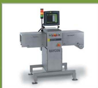
Ανιχνευτές Ξένων Σωματιδίων με Ακτίνες Χ