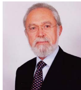
κ. Σπύρος Ζησιμόπουλος, πρόεδρος της Επιτροπής Ανταγωνισμού

ΜΕΣΑ στο καλοκαίρι, αναμένεται, η απόφαση της Επιτροπής Ανταγωνισμού για την αγορά της μπύρας. Στις αρχές της εβδομάδας πάντως η Ανεξάρτητη Αρχή ανακοίνωσε την απόφασή της για επιβολή προστίμου ύψους 468.870 ευρώ στην Vivartia, λόγω στρέβλωσης ανταγωνισμού στην αγορά διάθεσης κατεψυγμένων λαχανικών για οικιακή χρήση από τη Γενική Τροφίμων την περίοδο 2002-2006. Από την πλευρά της η VIVARTIA ανακοίνωσε ότι θα υπερασπίσει τις θέσεις της στα αρμόδια δικαστήρια.